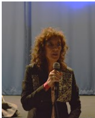
La Dirigente Scolastica Meuti

La Resistenza, quella civile, quella di chi non imbraccio le armi, ma dovette subire